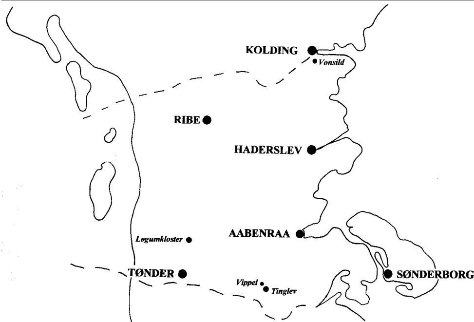
Sønderjylland med Løgumkloster, Vippel, Tinglev og Vonsild i kursiv.

kunne slæbe med sig. De smadrede dørene til kirkerne og røvede de ejendele, sognefolkene havde søgt at skjule.