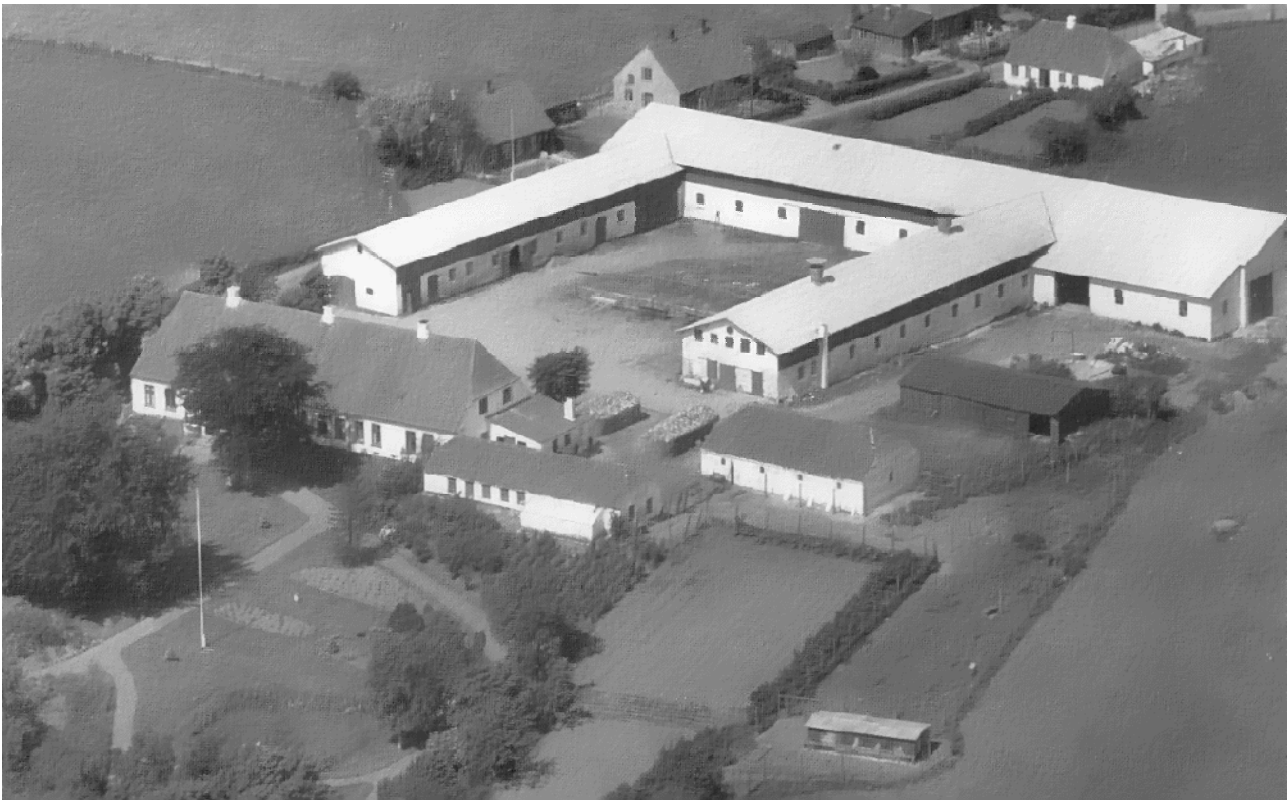
Foto: Sønderholm i slutningen af 1940-erne.

Vonsild i krig og fred og samtaler med forfatteren. Vonsild Kirkebog 1659-1708 og Slægterne Tinglev og Wiuff. Slægtsoplysninger.