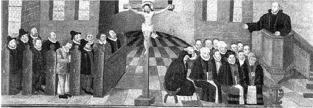
Maleri på fodstykket af altertavlen i Tinglev kirke fra slutningen af 1500-tallet (Fra Politikens og Gyldendals Danmarkshistorie bind 7, 1989).